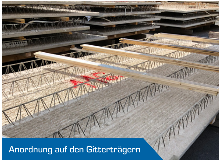
Anordnung auf den Gitterträgern